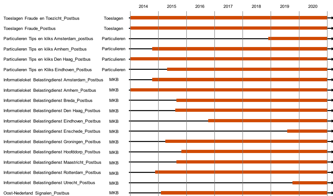
Figuur 4. Visualisatie analysepopulatie

Voor het onderzoek zijn achttien e-mailboxen van de drie directies verzameld. In het overzicht hieronder is zichtbaar welke e-mailbox is verzameld, bij welke directie de e-mailbox hoort en over welke periode er e-mailberichten beschikbaar bleken in de e-mailbox. Binnen de Belastingdienst noemt men een dergelijke niet aan persoon gebonden e-mailbox een postbus. In een postbus worden meldingen (tips en kliks) en informatieverzoeken vanuit andere organisaties of burgers ontvangen en zijn door medewerkers van de Belastingdienst verwerkt.