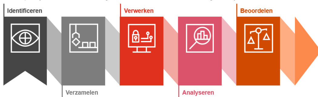
Figuur 1. Schematische weergave van het proces

Dit hoofdstuk beschrijft onze aanpak van het onderzoek en welke FSV-informatie met welke derde partijen in welke mate gedeeld is vanuit de achttien geanalyseerde e-mailboxen.