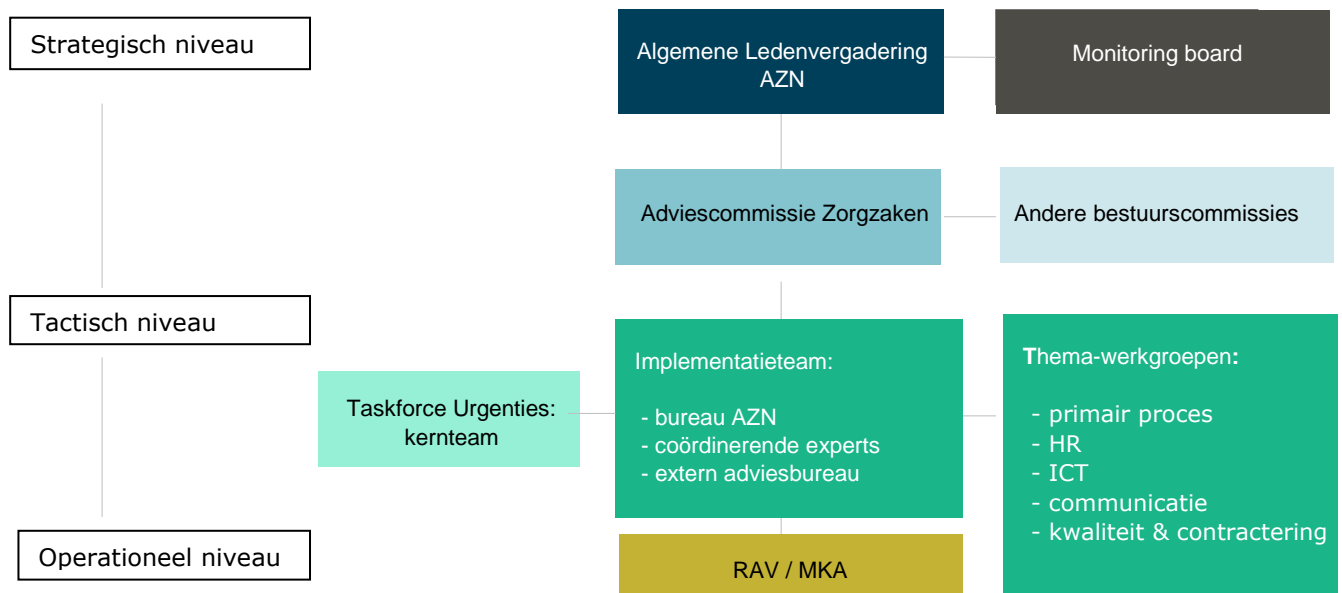
Figuur 2. Implementatie-organisatie verbeterde urgentie-indeling

De implementatie van de nieuwe of verbeterde urgentie-indeling vindt plaats door een implementatie-organisatie, welke aansluit op de huidige verenigingsstructuur van AZN. Het sectoraal implementatieteam en de thema-werkgroepen vormen samen met de monitoring board de implementatie-organisatie. Het al bestaande kernteam van de Taskforce Urgenties en de sectorale Adviescommissie Zorgzaken (ACZ) worden bij de invulling van de implementatie-organisatie betrokken. In deze twee overleggroepen zijn de Nederlandse Vereniging van Medisch Managers Ambulancezorg (NVMMA) en V&VN Ambulancezorg 2 vertegenwoordigd. Het kernteam van de Taskforce Urgenties begeleidt als het ware het implementatieteam, ze gaat daarbij na of de initiële wijzigingen van de urgentie-indeling voldoende leidend blijven. De monitoring board en het implementatieteam worden hieronder specifiek toegelicht.