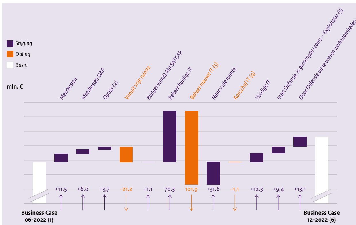
Figuur 4 Financiële ontwikkeling exploitatiekosten