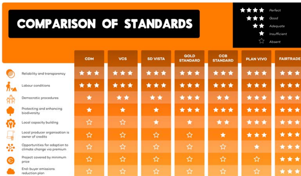
Figuur overzicht carbon credits standaarden

De impact van deze certificaten staat in onderstaande diagram van Fair Climate Fund: