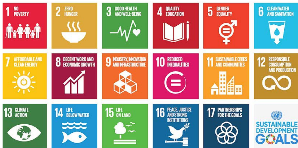
Figuur 1: The Sustainable Development Goals. Overgenomen van UNDP, 2016 ( https://commons.wikimedia.org/wiki/File:Sustainable_Development_Goals.jpg ), UNDP.

Duurzaamheid is niet alleen van Nederland. De 193 lidstaten van de Verenigde Naties (VN) hebben een ontwikkelingsagenda voor 2015 – 2030 vastgesteld. De agenda bestaat uit 17 doelen. Deze doelen heten voluit de Sustainable Development Goals maar worden vaak afgekort naar SDG's. Zij gelden in alle landen en voor alle mensen. De kern van de SDG's is een einde aan extreme armoede, ongelijkheid, onrecht en klimaatverandering.