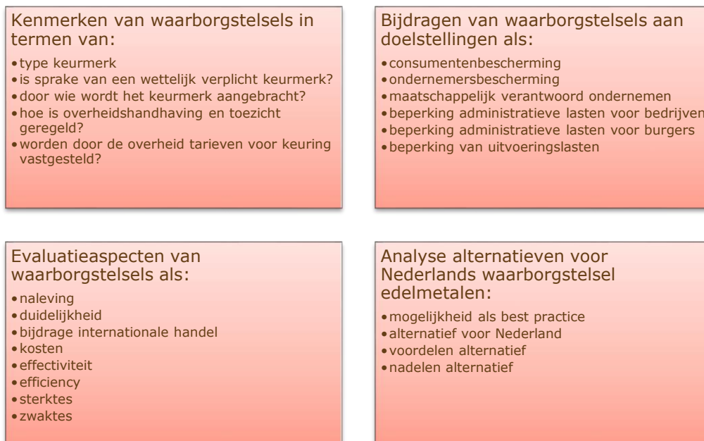
figuur 2 Beoordeling aspecten waarborgstelsels

Eerst wordt in paragraaf 3.2 ingegaan op een vergelijking van het Nederlandse waarborgstelsel voor edelmetalen met waarborgstelsels voor edelmetalen van nabijgelegen landen. In paragraaf 3.3 gaan we in op een vergelijking met waarborgstelsels van diamanten en kunstvoorwerpen in Nederland.