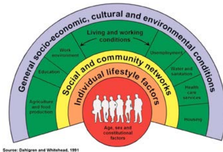
Figuur 2: Sociale determinanten van gezondheid

Een gezonde leefomgeving is essentieel om gezondheid van mensen te stimuleren. Dahlgren en Whitehead 55 (zie Figuur 2) geven aan dat persoonlijke eigenschappen, individuele leefstijlfactoren, sociale netwerken, leef- en werkcondities, en de bredere sociaal-culturele en economische omgeving gezamenlijk bepalend zijn voor gezondheid.