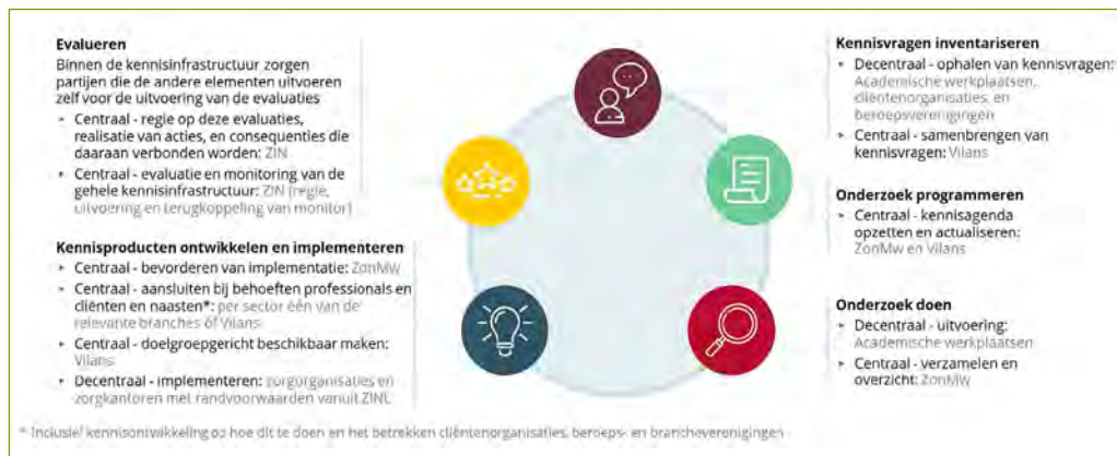
Figuur 2 | Mogelijke governance van de kennisinfrastructuur