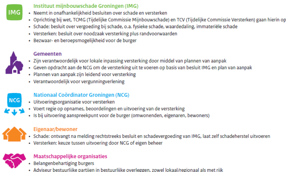
Figuur 2 – Het eindbeeld schade en versterken dat ontstaat na o.a. de wettelijke verankeringen van de nu per besluit vastgestelde werkwijze.