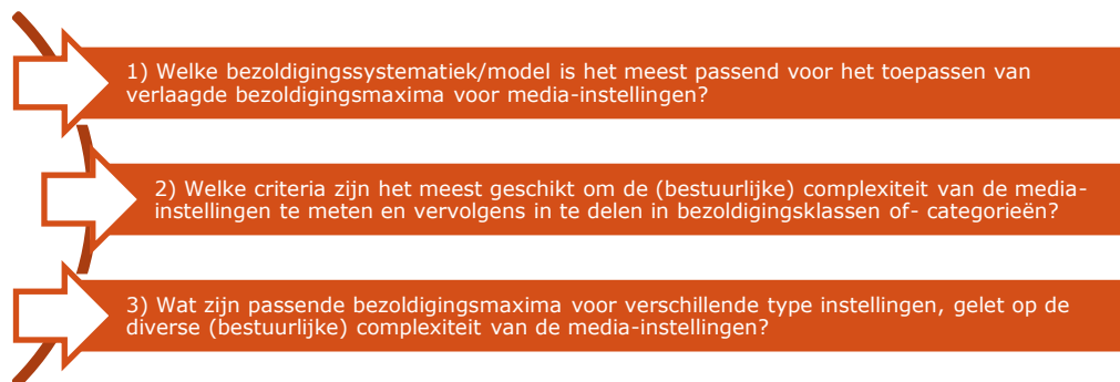
Figuur 2 Onderzoeksvragen

Om een goed beeld te geven hoe de bestuurlijke complexiteit van publieke media-instellingen kan worden gemeten en welke bezoldigingssystematiek geschikt is voor het vaststellen van verlaagde bezoldigingsmaxima voor topfunctionarissen van media-instellingen zijn de volgende drie onderzoeksvragen geformuleerd (zie figuur 2).